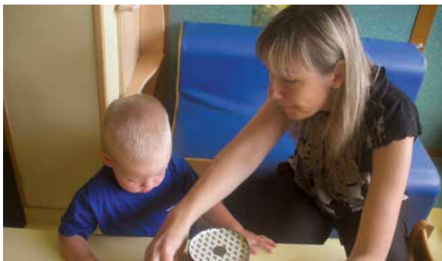
Predstavitve dejavnosti vstavljanje, katere cilj je izpopolnjevati koordinacijo oko-roka in motoriko roke.