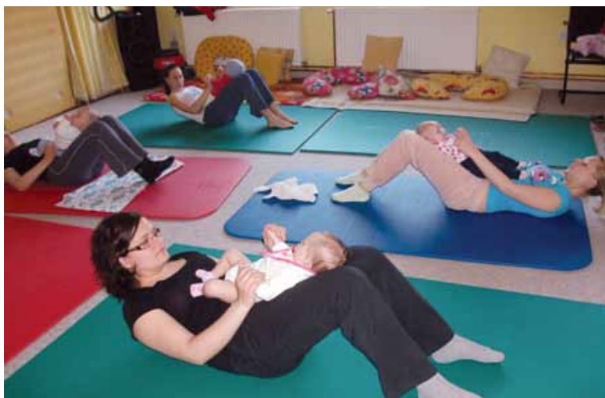
Ena od številnih dejavnosti društva Štoklja je telovadba mamic z dojenčki.

otroke in podjetja, organizirata praznovanja rojstnih dni, nekaj povsem unikatnega pa je njun prispevek v nedeljski oddaji Ustvarjamo skupaj na TV Golica. »Imava še veliko načrtov; razmišlja o možnostih izvedbe unikatnih eko igrač, ki bi spodbujale razvoj otrok med igro. V vseh aktivnostih, ki se jih bova lotevali v prihodnje, pa dajeva prednost na-